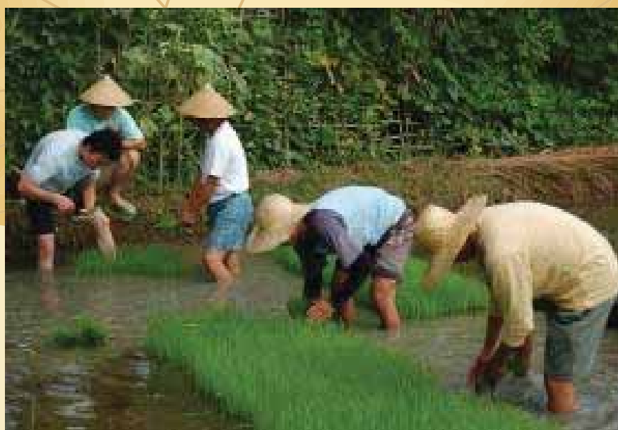
兩名西安天主教社會服務辦公室的職員在菲律賓下田受訓

為了解決十三億人口的糧食問題，在過去數十年來，內地有關部門和人士都大量使用化肥和殺蟲劑。此舉雖然可在短時間內增加農作物的收成，但長遠來說，對整個生態環境遺害無窮。而最大的問題是，大部分農民並不認識化肥和殺蟲劑的害處。近年，內地政府也意識到這問題，並建立了一套無公害耕作的指標。無奈市場價格不配合，農民缺乏誘因實踐無公害耕作，致使化肥化藥的禍害遲遲未得到改善。