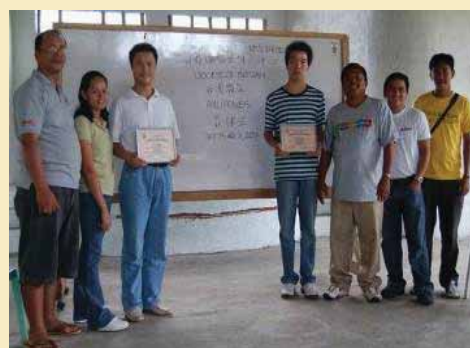
培訓後，與菲律賓的導師們合照

國內服務計劃辦公室一直也關注這問題，並希望帶動國內的天主教社會服務中心參與，提高一般農民對無公害農業的認識。去年底和今年初，在亞洲全人發展協會(Asia Partnership for Human Development)的資助下，並在西安天主教社會服務中心的協助下，兩個為當地農民而設的無公害農業工作坊，得以在陝西省白水縣開展。其他工作坊將在今年底繼續進行。