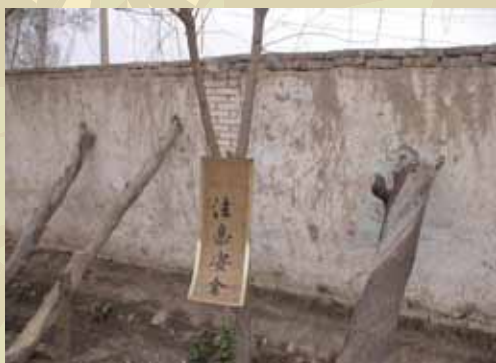
危牆用木頭支撐著，並貼出警告字樣