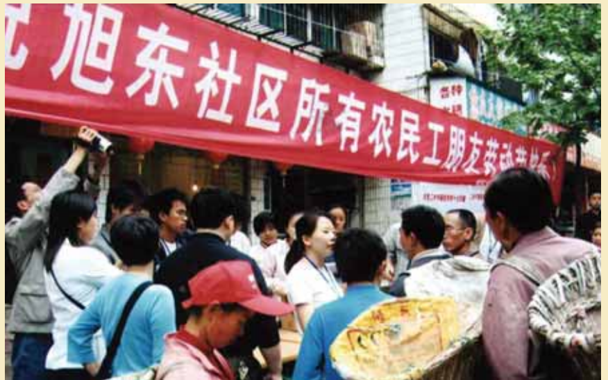
農民工參與旭東中心的活動

近年來，貴陽市政府陸續推出有關維護農民工合法權益的政策和措施，農民工的生活境遇有所改善；但由於這個弱勢社群數目較大，政府無力面面俱到；而貴陽市還沒有民間機構提供實質的援助。