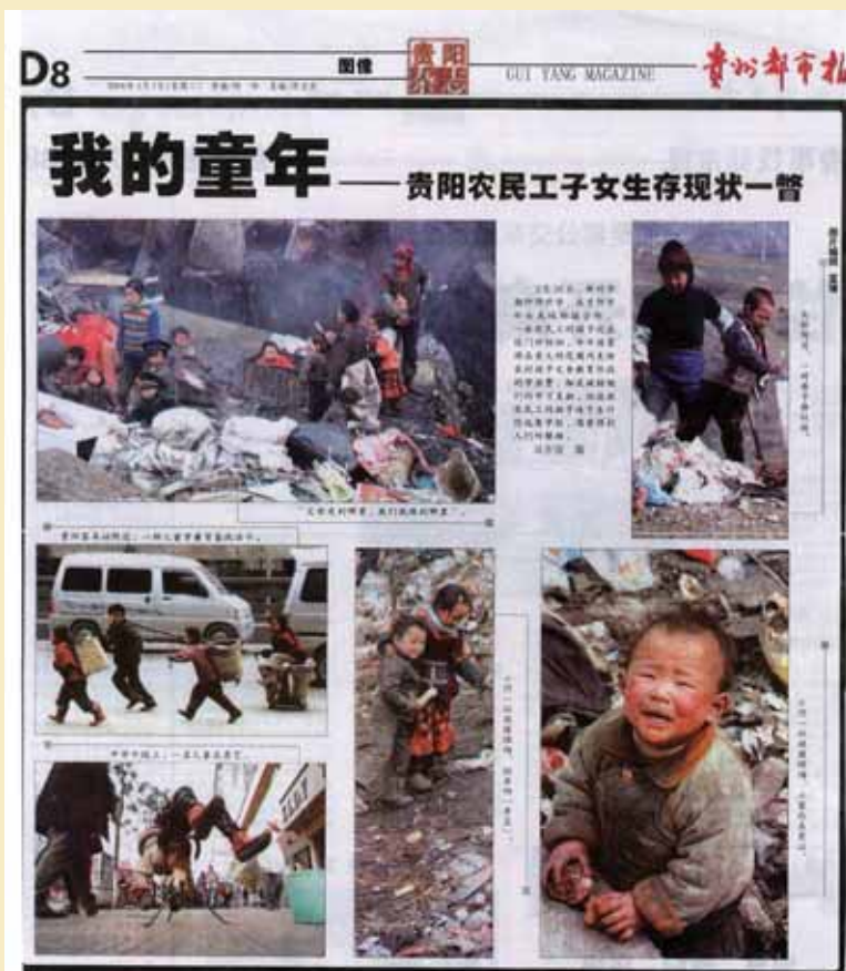
貴陽傳媒關注農民工在城市的生活情況

有見及此，香港明愛社會工作服務部與貴州大學社工系在德國米索爾基金會的資助下，於2006年開展了「貴州農民工服務計劃」，以貴陽市黔東辦事處屬下旭東社區為服務試點。旭東社區位於貴陽市東城郊結合處，是農民工較為集中的社區。加上社區居委會的支持，我們得以為該區的農民工及其家庭成員提供服務。這計劃的服務包括：