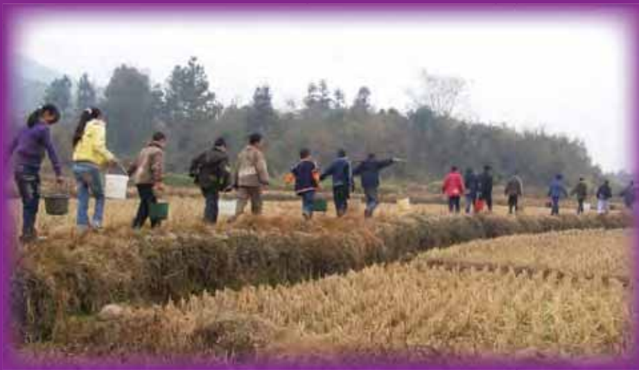
到兩公里外的水池挑水，已成學生每天的課餘活動

當地政府因財政緊拙，除了出資2,000元，只能負責引電打井的費用。村民亦自籌了人民幣4,368元，但還有人民幣51,632的缺口無法解決，校方遂寫信到香港明愛求助。