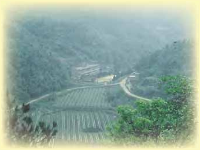
能飲用自來水，村民眉開眼笑