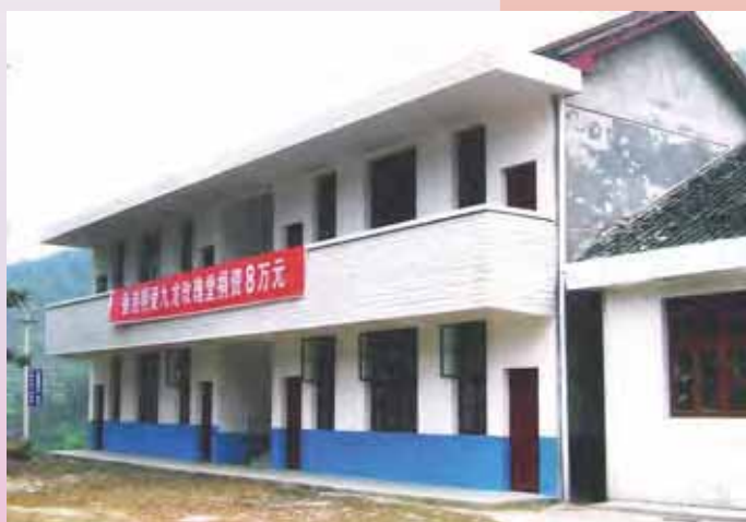
沿溪鄉小學新建教學樓

有見及此，該校決定為學生重建一座兩層高的教學樓。建材及運費共人民幣八萬元；由村民投工投勞建校。但當地政府為救濟和災後重建已耗用大量資源，村民亦損失不少家財，根本無力自資建校。於是，懷化堂區的神父便寫信到香港明愛求助。但半年下來，我們仍物色不到有心人。今年四旬期，九龍玫瑰堂邀請香港明愛到該堂分享經驗，我們便把這個案與教友分享，沒想到很快便籌得所需善款，沿溪小學的重建工程最終在今年六月動工，於九月完成。