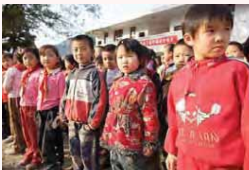
孩子們在新樓內上課

2006年6月，湖南洪水為患。其中懷化市溆浦縣的受災人數達三十萬人，公路、房屋被沖走；直接經濟損失達2.27億元。在被洪水摧毀的房子中，包括沿溪鄉的中心小學。該校建於五十年前，教學樓在水災後變成頹垣敗瓦，六個班共180位學生被迫搬到山上的中學部上課。因地方不夠；學校便唯有租用附近民房上課，教學質量因而大受影響。