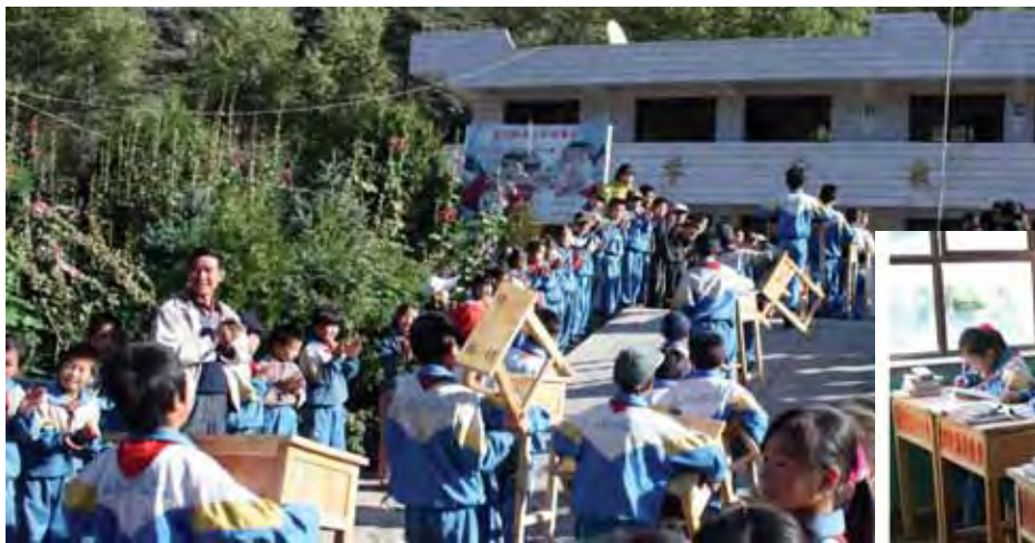
學生協助搬運新桌椅進校