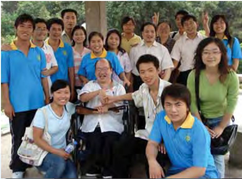
光愛之家和星城志願者