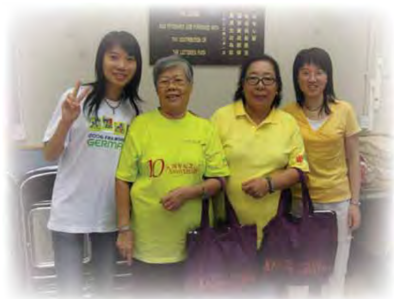
兩名實習同學與長者中心的長者

隨著香港與內地社會服務界的合作不斷增加，為了讓國內社會工作系的學生能有機會擴闊視野，香港明愛社會工作服務部近年開始安排國內社工系的學生來港體驗。2007年，我們一共邀請了12位來自四間國內大學的學生，到香港明愛的服務單位進行交流。他們透過明愛同工的介紹和直接參與，了解到社工的理念和明愛的服務；並有機會參加社工研討會和機構的迎新活動。以下是其中一位同學的感受：