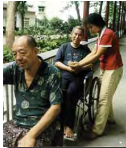
協助殘疾人士外出