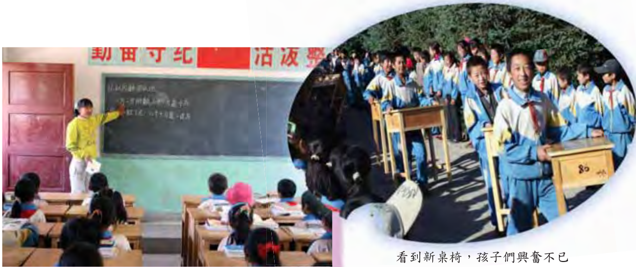
看到新桌椅，孩子們興奮不已

雖然學校的資源有限，但春蕾小學的學生和老師都很爭氣。在過去二十年，該校學生的合格率為全鄉之冠；有多位教師更被評為縣、鄉優秀老師。