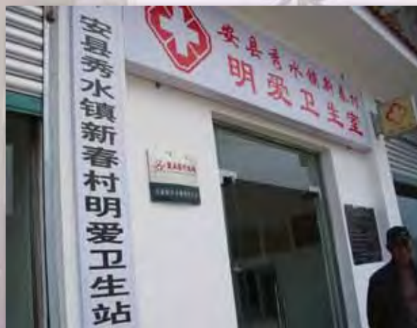
在新春村新建的明愛衛生室