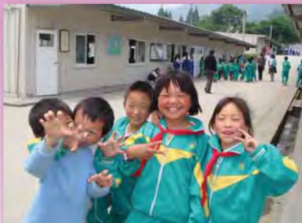
雖然經歷了地震，但在老師和社工們的照顧下，學生們仍能展笑顏