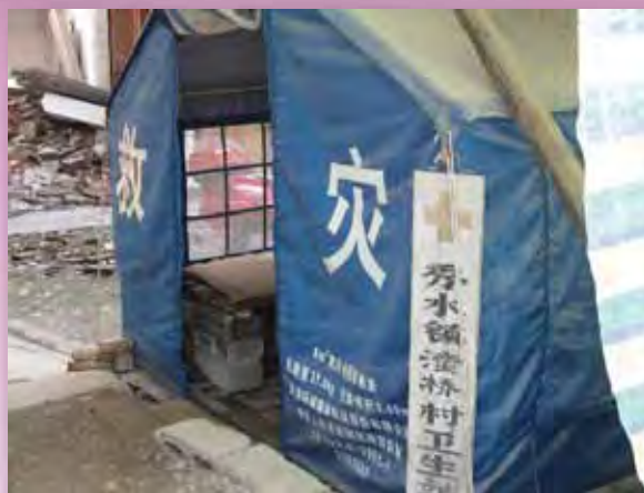
地震後在帳篷內提供服務的臨時診所