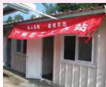
在板房內的社工站

但數月後，作為一個內地民辦組織，「啓創」根本不夠資源繼續在水磨鎮服務。香港明愛看到該會在災區所開展的成績，自2009年2月，便聯同日本明愛，資助該會在水磨鎮繼續服務，為期兩年。