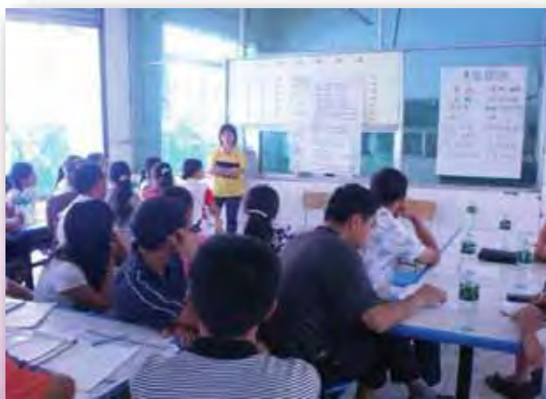
社工為老師們辦工作坊

水磨小學的重建工程至今已差不多完成。「啓創」的服務亦將在新校繼續發展。期望藉著「啓創」的服務，水磨小學的學生得以健康成長。藉著他們的服務，也希望老師和家長；以至學校附近的社區，能慢慢走出災難的陰霾。