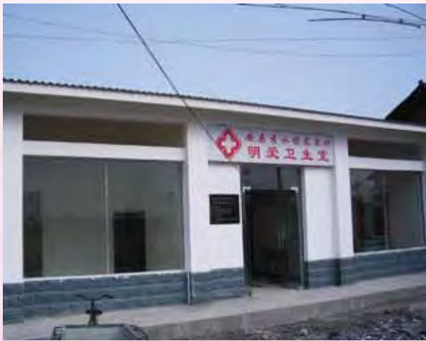
在龍泉村新建的明愛衛生室