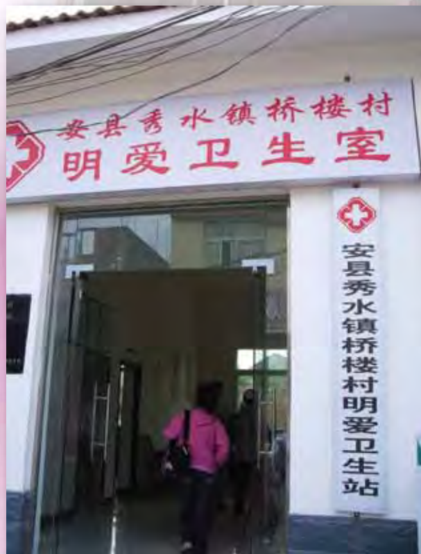
在橋樓村新建的明愛衛生室

地震過後，四川數百個村診所驟成頽垣敗瓦，村醫生只能借用民房或在帳篷內繼續提供醫療服務。有見及此，香港明愛於去年十月資助了安縣四個村診所的重建工程。這四個診所分別位於新春村、橋樓村、潼橋村和龍泉村。總受惠人數接近七千人。