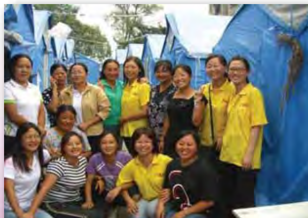
啓創社工與水磨學校的老師成了緊密的合作伙伴