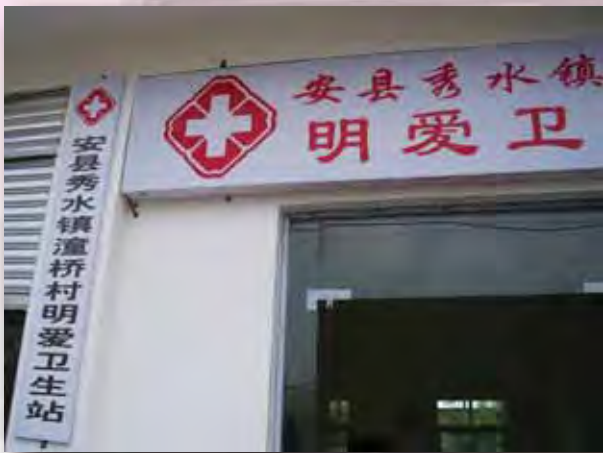
在潼橋村新建的明愛衛生室