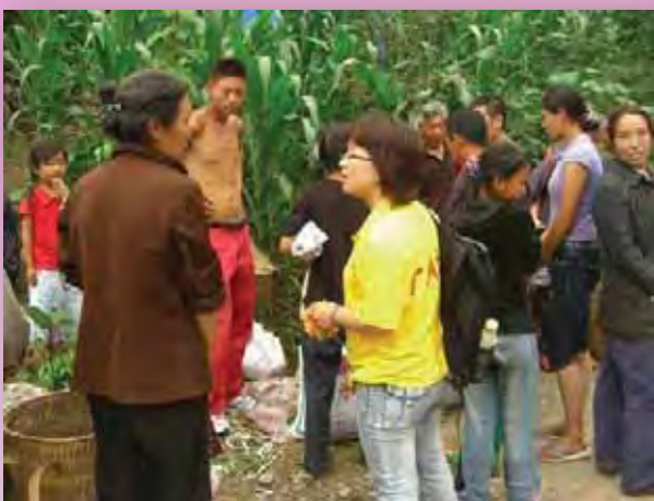
啓創社工定期到學校附近的社區作家訪