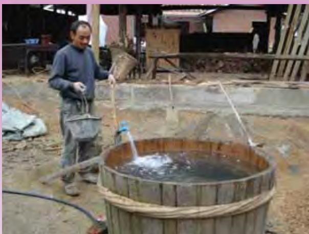
通口鎮村民目前用水情況