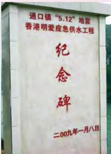
在通口鎮內，樹立了愛心水利工程的紀念碑

最後，十一條村的水利工程在去年12月30日全部竣工，解決了1,912戶5,891人及3,790頭牲畜的用水問題，同時還解決了920畝農田的灌溉問題。當地災民對香港人無私的幫助深表謝意。