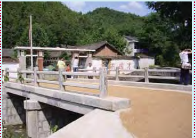
有鋼管護欄的新混凝土橋