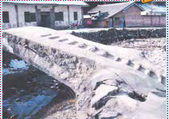
馬河小學石橋舊貌

新橋的建造工程於2009年1月中旬竣工。以往教師的摩托車不能直接騎到學校，在回校前必須寄存到附近村民的家。新橋建成後，老師可直接把車開到學校，節省了老師不少時間。在雨雪天氣下，家長和教師也不用護送孩子回校了。對於香港善心人的幫助，馬河村村民和馬河小學的師生感激不已。