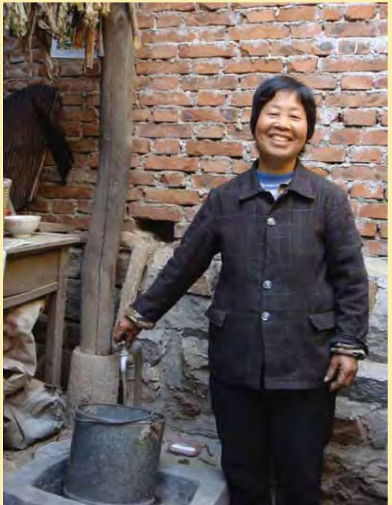
能用上自來水，村民笑逐顏開