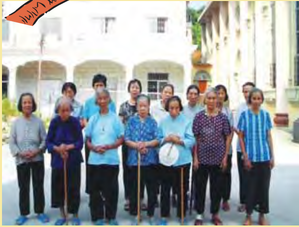
長者們在塔山老人院門前

中國人口老化問題日益嚴重。福建省雖為富庶之地，但在山區獨居的貧病老人卻鮮為人關注。閩東教區的貞女一向以照顧殘疾孤兒為主要使命，閒時亦常到山區探訪貧病的獨居老人，但因老人分散各地，貞女們人手不足，在善心人的幫助下，於寧德縣塔山鄉建了一所可容納90位老人的敬老院，於今年十一月竣工。此敬老院除照顧無依長者，亦預留了部分宿位予有能力負擔宿費的長者入住，以達至自養的目的。工作人員亦在院內設診症室，務求做到自給自足。