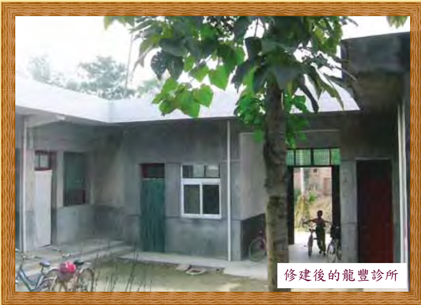
修建後的龍豐診所