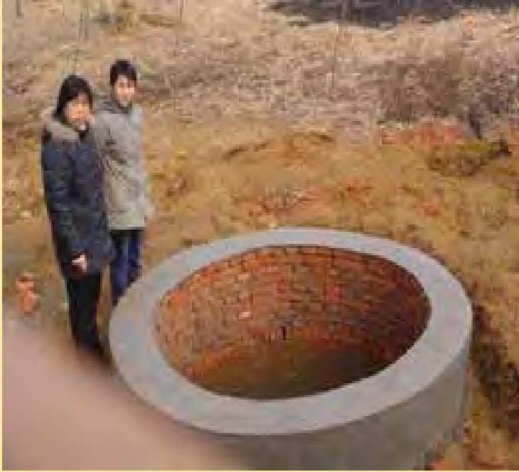
監督項目的修女視察水井情況

位於河北省太行山脈的李莊村，由於地處偏僻，人口只有200多人。村民靠種地為生，生活清貧，其中吃水是他們最大的問題。