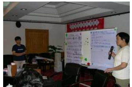
小組討論後，學員分組匯報