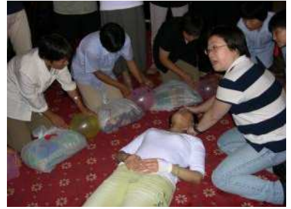
香港導師以「枕頭病人」教授心肺復甦法