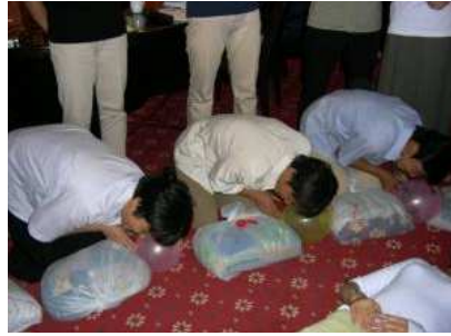
學員以「枕頭病人」練習心肺復甦法