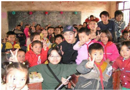
香港的客人來訪，孩子們好不開心

「春天必會來，培育農民下一代……我們付出過，我們付出過，就是為了教育好……」(摘自《龍情心》)。《龍情心》是「龍情聚」小組的會歌，歌詞內容道出了組員的心聲，也揭示了小組的方向。