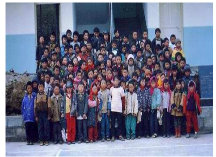
孩子們聚集在新校前，期待到裡面上課

返校園，甚至要走10多公里的 昭通教區的神父了解該村的需要後，於2003年寫信到香港明愛求助。國內服務計劃辦公室的代表於2003年6月趁著到云南考察之便，特地到老林村了解情況，證實該村實在有建一個小學的需要。我們隨即與當地負責教育工作的政府人員研究建校的計劃。他們希望在老林村興建一個兩層高的完全小學，連操場、廁所及圍牆的造價約200,000元，估計可容納150位學生。跟以往的項目一樣，我們要求當地政府出一半的建校費，而香港明愛則