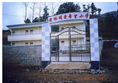
村民把學校命名為「老林明愛希望小學」