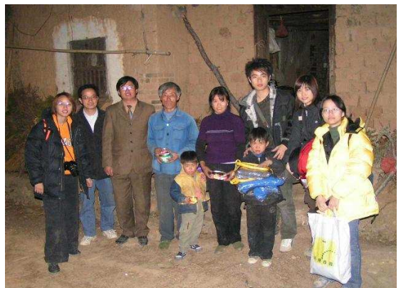
鄉村老師與香港義工在互動的關係中學習、成長