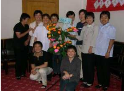
工作坊結束後，學員在「承諾樹」前合照