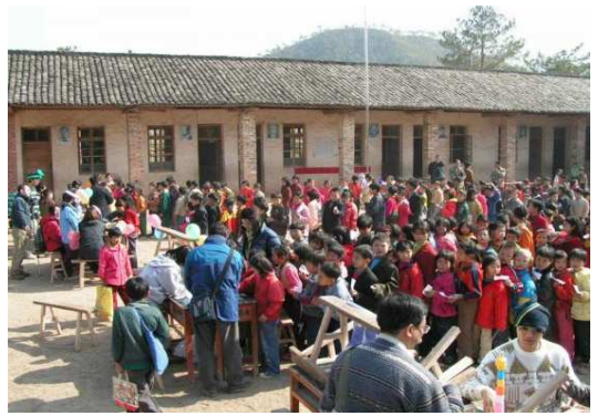
「龍情聚」在村中舉行集會，好不熱鬧