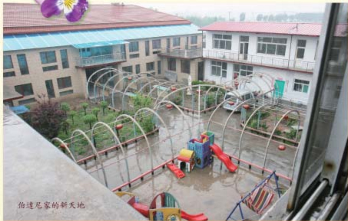
伯達尼家的新天地

伯達尼之家孤兒院在1997年成立，建於山西太原一個農村，住了33名被遺棄的殘疾孩子。該孤兒院由一個貞女團體管理。由於孩子日漸成長，房子原來的設計已不能滿足他們的需要。男女青年住在一處，對青春期的孩子甚為不便。此外，嚴重殘疾和肢體健全的孩子一同起居，也未能顧及他們的個別需要。廁所設在房子外面，亦不方便。最大的問題是消防設備不足，造成安全隱患。2014年1月《華訊》報道了伯達尼之家的情況。有關裝修工程所需費用，有幸獲得善長人翁慷慨支持。