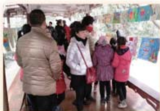
家居安全兒童畫展

針對此問題，甘肅蘭州市樂康青少年社會服務中心於2015年，在市內一個社區和農村兩個社區，舉辦為期四月的兒童家居安全教育活動，參與的家庭約200戶。該項目獲香港明愛資助。