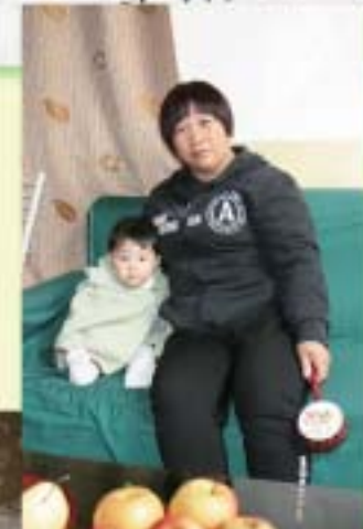
孩子得到悉心照顧