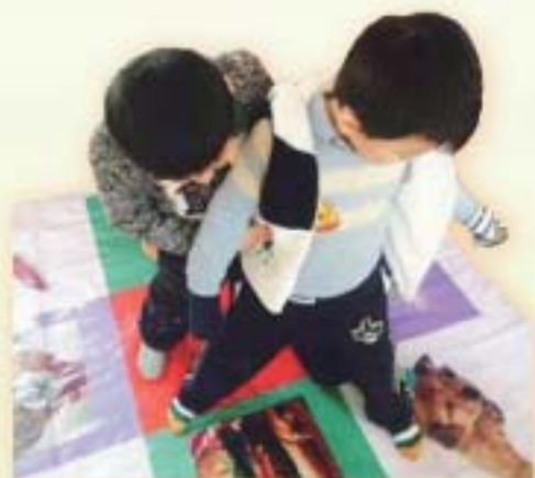
玩遊戲學安全規則

項目內容包括：交通安全、食品安全、藥品安全、生活環境安全等一系列親子活動，以及透過角色扮演、兒童畫展、說故事等，加深家長和孩子對家居安全的關注。此外，樂康中心建立互動平台網站，讓家長互相聯繫，分享安全資訊和經驗。