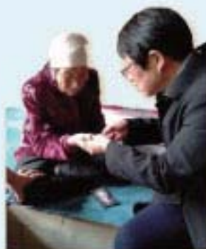
家訪長者提供服務

您好！我們是內蒙包頭的虐女，一直在農村服務。目睹大量年輕人往城市打工，家中留下長者，乏人關顧。由於子女不在身邊，留守長者一般過著孤獨生活，不少出現抑鬱症狀。他們的經濟來源，主要靠自己勞動所得和子女的有限供給，且絕大部分沒養老保險。這些長者的健康和生活狀況，令人擔心。