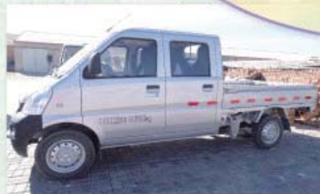
運送產品的小貨車