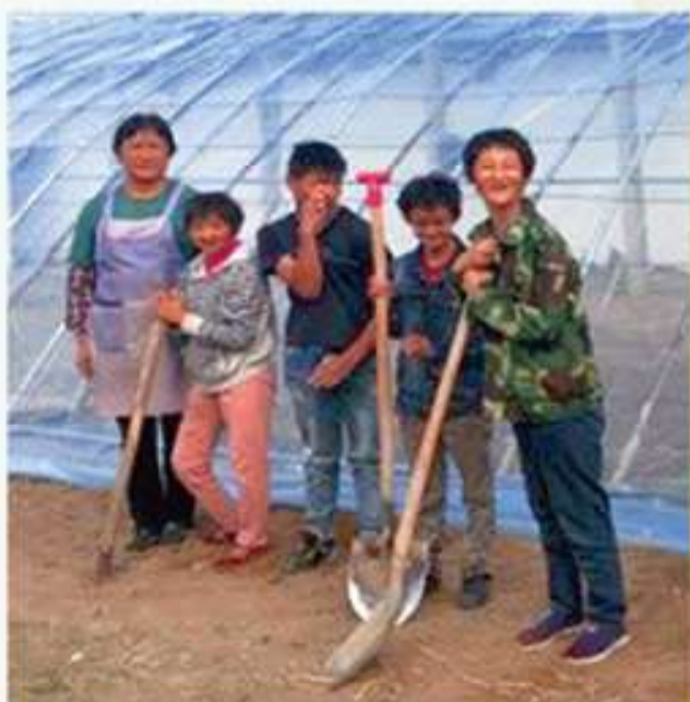
孩子與修女攝於溫室外

非常感謝香港明愛及善長的支持，讓我們的孩子、老人和服務人員，每天也能嘗到新鮮的蔬菜，同時也免去了我們舟車勞頓之苦。